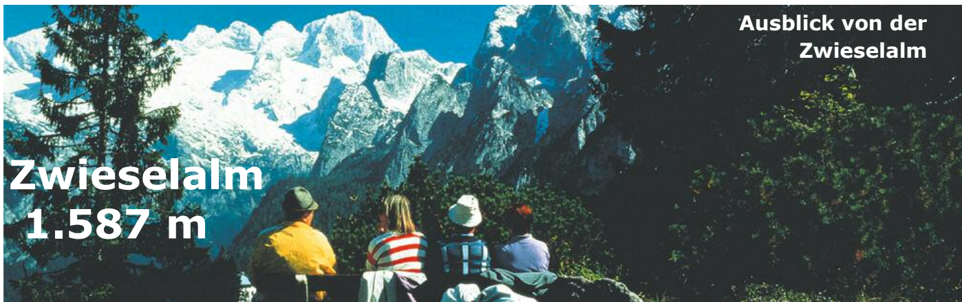
Ausblick von der Zwieselalm