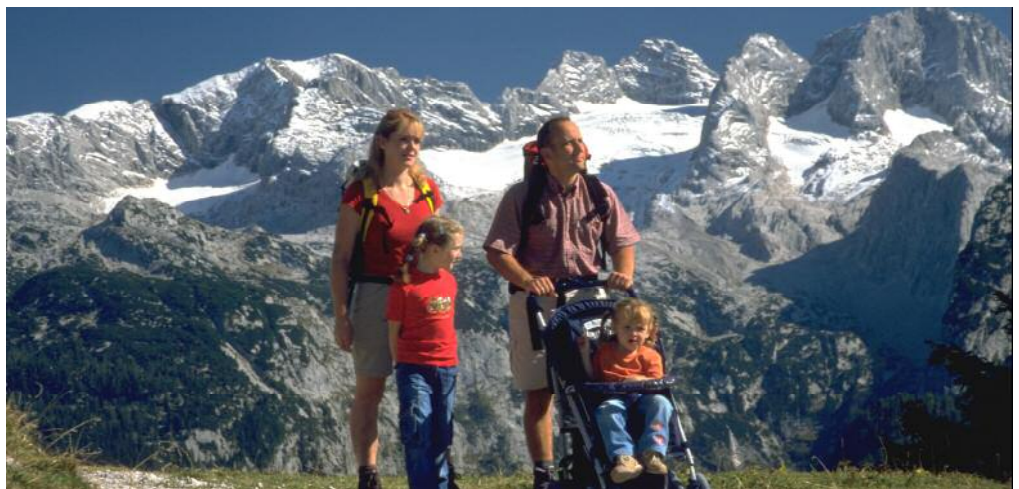
Auf der Zwieselalm kann man auch mit dem Kinderwagen fahren

Dieser Weg führt vom Hotel Sommerhof, entlang der Erlergasse und durch den Wald bis zur Forststraße, die Sie nach ca. 45 Minuten erreichen; Weg Nr. 601, 611. Folgen Sie der Forststraße ein kurzes Stück bergwärts, dann kommen Sie zu der Abzweigung des Herrenweges (Wegweiser „Zwieselalm“).